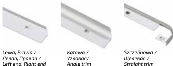
Lewa, Prawa / Левая, Правая / Left end, Right end