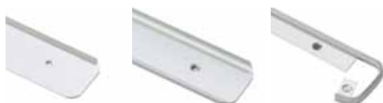
Lewa, Prawa / Левая, Правая / Left end, Right end